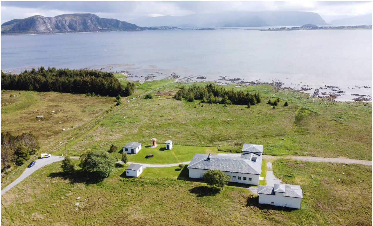
Vigra kringkaster og havområdet mot sør.

Vi viser til midlertidig freding datert 13. juli 2018 og tidlegare høyringsbrev om oppstart av freding av Vigra kringkaster datert 16. juli 2020. Møre og Romsdal fylkeskommune sender med dette ut forslag til freding av Vigra kringkaster, på gbnr 6/5/1 og 6/5 i Giske kommune.