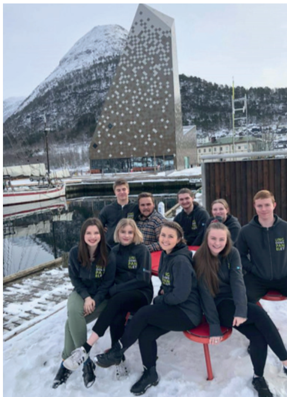
Ungdomspanelet 2017/2018 har jobba for å følge opp vedtaket frå UFT 17. Bildet er frå Åndalsnes kor ordføraren i Rauma kommune presenterte korleis dei har jobba med by- og tettstadutvikling.

Den største flyttestraumen i Noreg går til dei største byane Oslo, Bergen og Trondheim. Dette gjeld særleg unge som nettopp er ferdig med vidaregåande skole.