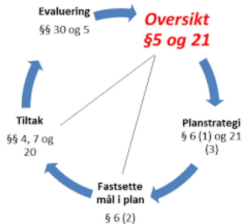
Figur 2. Det systematiske folkehelsearbeidet

Kommunal folkehelseoversikt er sentral i det systematiske folkehelsearbeidet, og skal vere eit viktig utgangspunkt for planarbeid og tiltak i kommunane. For at oversikta på best mogleg måte skal fange opp både utfordringar og faktorar som folk opplever som helsefremmande, må oversikta vere basert på opplysningar og data som er samla både gjennom kvantitative og kvalitative metodar. Elementa og logikken i det systematiske folkehelsearbeidet er skissert i figuren som følgjer.